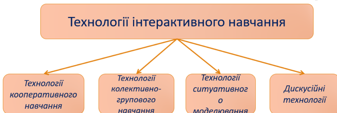
Рис. 2.6. Технології інтерактивного навчання